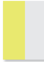
1/2 Seite hoch

R: 210 x 148 mm S: 173 x 125 mm 4f CHF 1'700