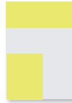
1/4 Seite quer/hoch

R: 104 x 297 mm S: 83.5 x 254 mm 4f CHF 1'700